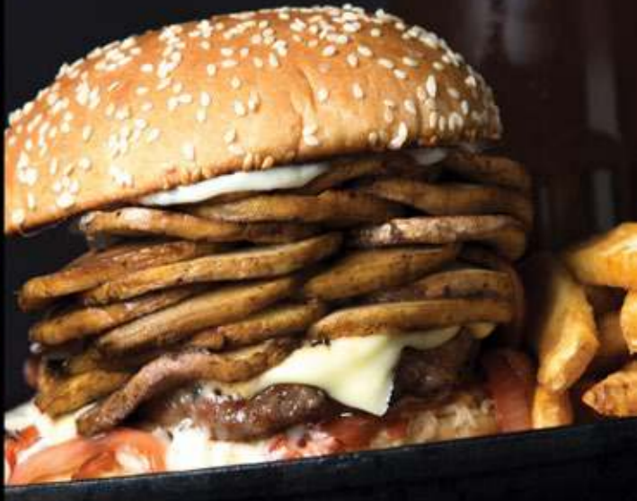
MORRISON BURGER $75

Carne de res, cebolla morada, pepinillos, queso estilo americano, mayonesa BBQ, mayonesa, jitomate y lechuga.