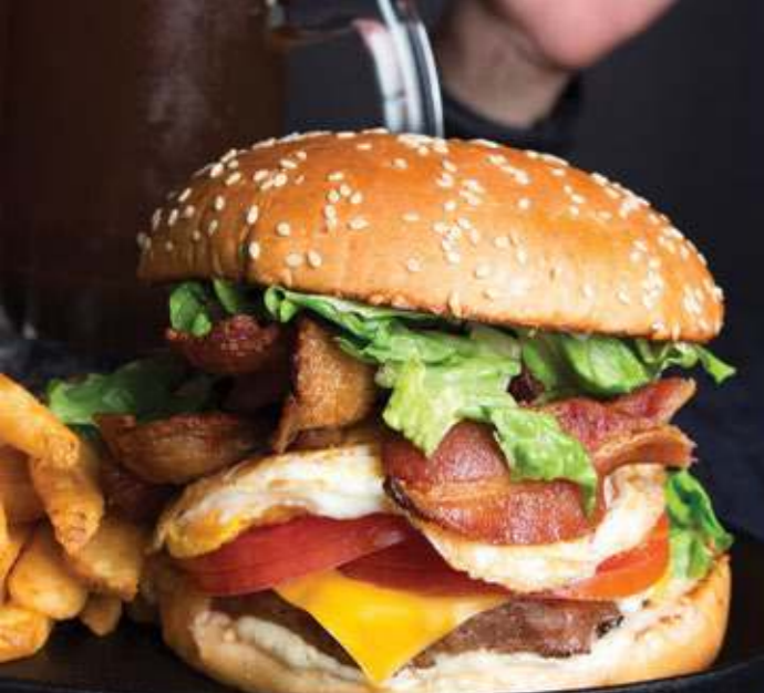
SUBLIME BURGER $85

Carne de res, tiras de tocino, huevo frito, queso tipo americano, mayonesa, lechuga y jitomate.