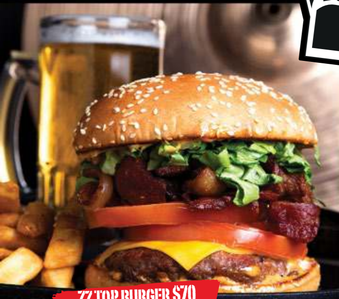
ZZ TOP BURGER $70

Carne de res estilo blackened, cebollas bravas, tiritas de tortillas fritas, guacamole, queso estilo pepper jack, mayonesa de chipotle, rebanadas de chile poblano y lechuga.