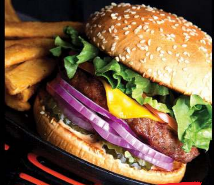
LENNON BURGER $70

Carne de res estilo blackened, pimienta morrón (rojo), queso estilo pepper jack, mayonesa de chipotle, lechuga y jitomate.