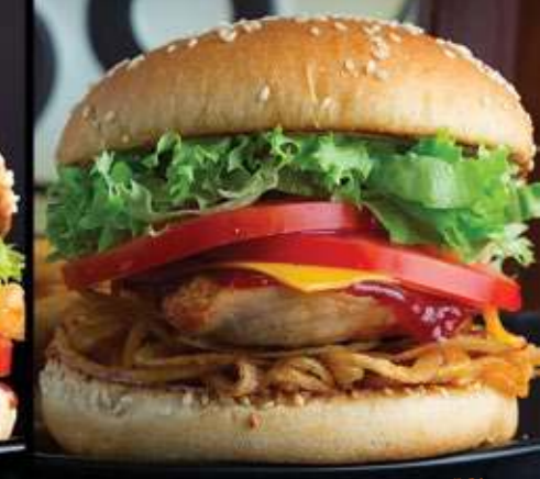
ROCKSTAR CHICKEN BURGER $80

Pechuga de pollo marinada en salsa teriyaki, piñas marinadas, queso cheddar, mayonesa, lechuga y jitomate.