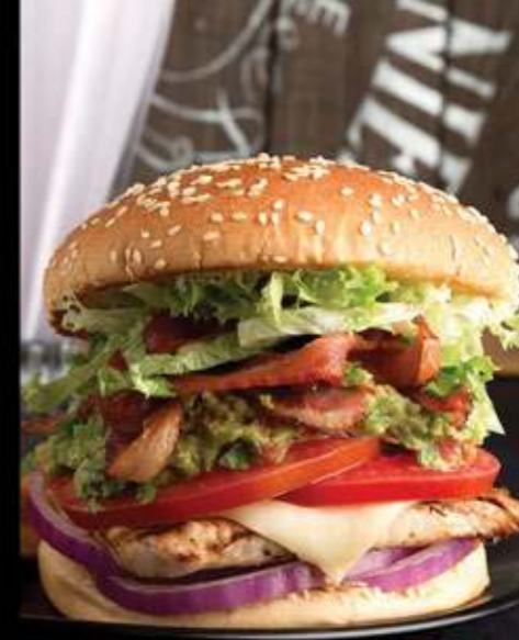
ELVIS BURGER $85

TODAS NUESTRAS HAMBURGUESAS VAN ACOMPAÑADAS DE PAPAS O ENSALADA O VEGETALES TERIYAKI. INGREDIENTE EXTRA $15, CARNE O POLLO EXTRA $30. CAMBIO DE RSB FRIES A BUFFALO FRIES POR $5.