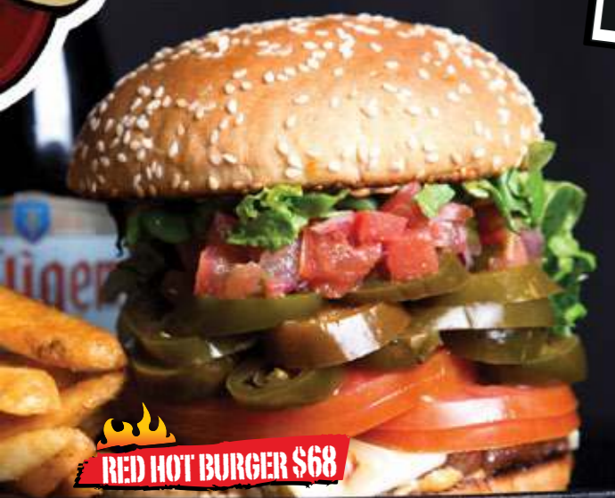
RED HOT BURGER $68

Carne de res, spicy chipotle mayo, rodajas de jalapeño, queso estilo pepper jack, salsa fresca, jitomate y lechuga.