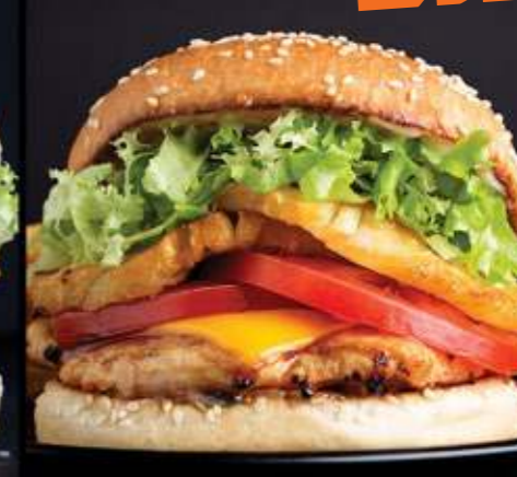
QUEEN BURGER $76

Pechuga de pollo empanizada, mayonesa, piñas, mayonesa BBQ, pepinillos, cebolla morada, lechuga y jitomate.