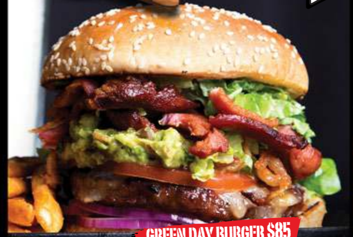
GREEN DAY BURGER $85

Carne de res con crujientes tiras de tocino, guacamole, mayonesa, queso suizo, cebolla morada, lechuga y jitomate.