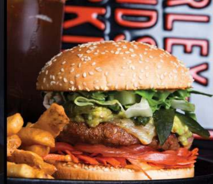
HENDRIX BURGER $83

Carne de res, tiras de tocino, huevo frito, queso tipo americano, mayonesa, lechuga y jitomate.