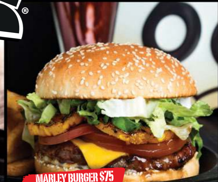
MARLEY BURGER $75

Carne de res, tiras de tocino sazonado, mayonesa de chipotle, queso cheddar, lechuga y jitomate.