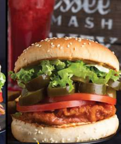
ZEPELIN BURGER $85

Pechuga de pollo estilo Blackened, queso estilo pepper jack, mayonesa de chipotle, cebolla morada, lechuga y jitomate.