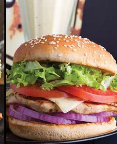
STONE BURGER $75

Pechuga de pollo a la parrilla, tocino, guacamole, queso estilo suizo, mayonesa, cebolla morada, lechuga y jitomate.