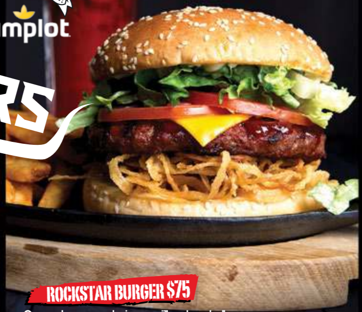
ROCKSTAR BURGER $75

Carne de res, exclusivas pajillas de cebolla, mayonesa, salsa BBQ, jitomate, lechuga y queso tipo cheddar.