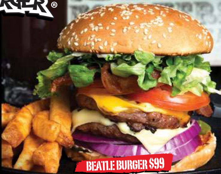
BEATLE BURGER $99

Carne de res con crujientes tiras de tocino, guacamole, mayonesa, queso suizo, cebolla morada, lechuga y jitomate.