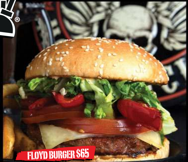
FLOYD BURGER $65

Carne de res, spicy chipotle mayo, rodajas de jalapeño, queso estilo pepper jack, salsa fresca, jitomate y lechuga.