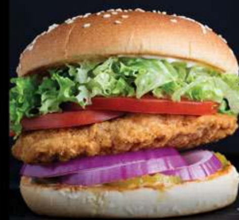
CLAPTON BURGER $80

Pechuga de pollo empanizada, mayonesa, piñas, mayonesa BBQ, pepinillos, cebolla morada, lechuga y jitomate.